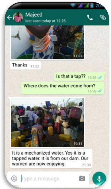
Een WhatsApp uit 2015